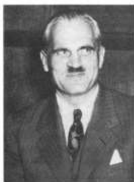
Д-р Артур Комптоун (снимка от 1946 г.)