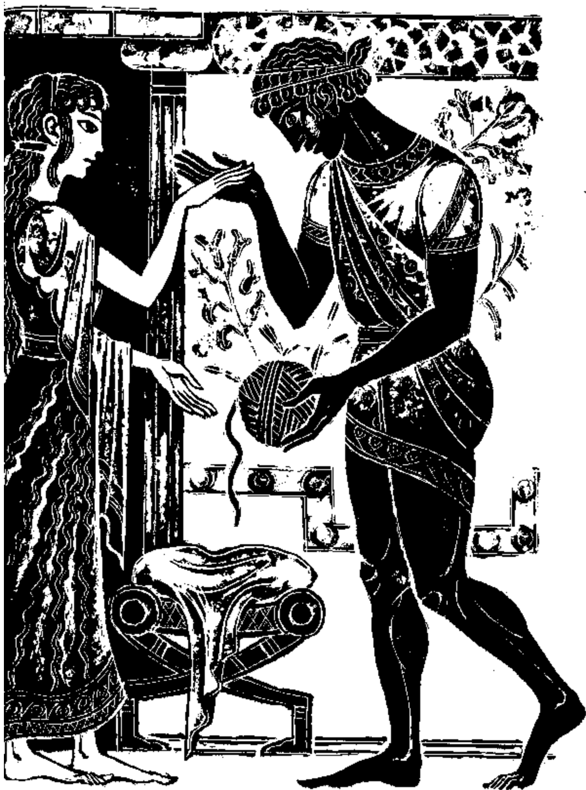
Тезей погледна учудено кълбото.