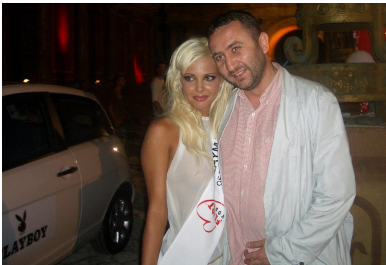
Никоleta и плейбой-редакторът позират на фона на розовата „Ланча“, която русата пловдивчанка спечели от конкурса