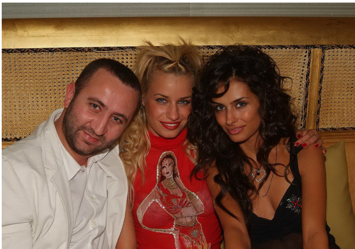
Плейбой-редактор, Яна и Жана журират в „Планет клуб“ конкурс от веригата Miss Flirt

Зад кулисите на конкурсите Flirt Playboy Connection винаги беше голяма жега