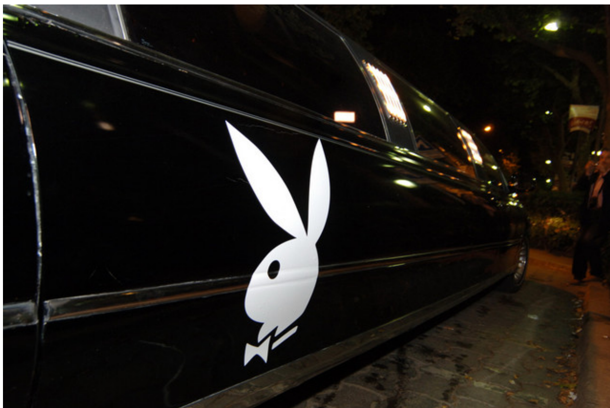
Лимузината на Хефнър и приятелките му пристига