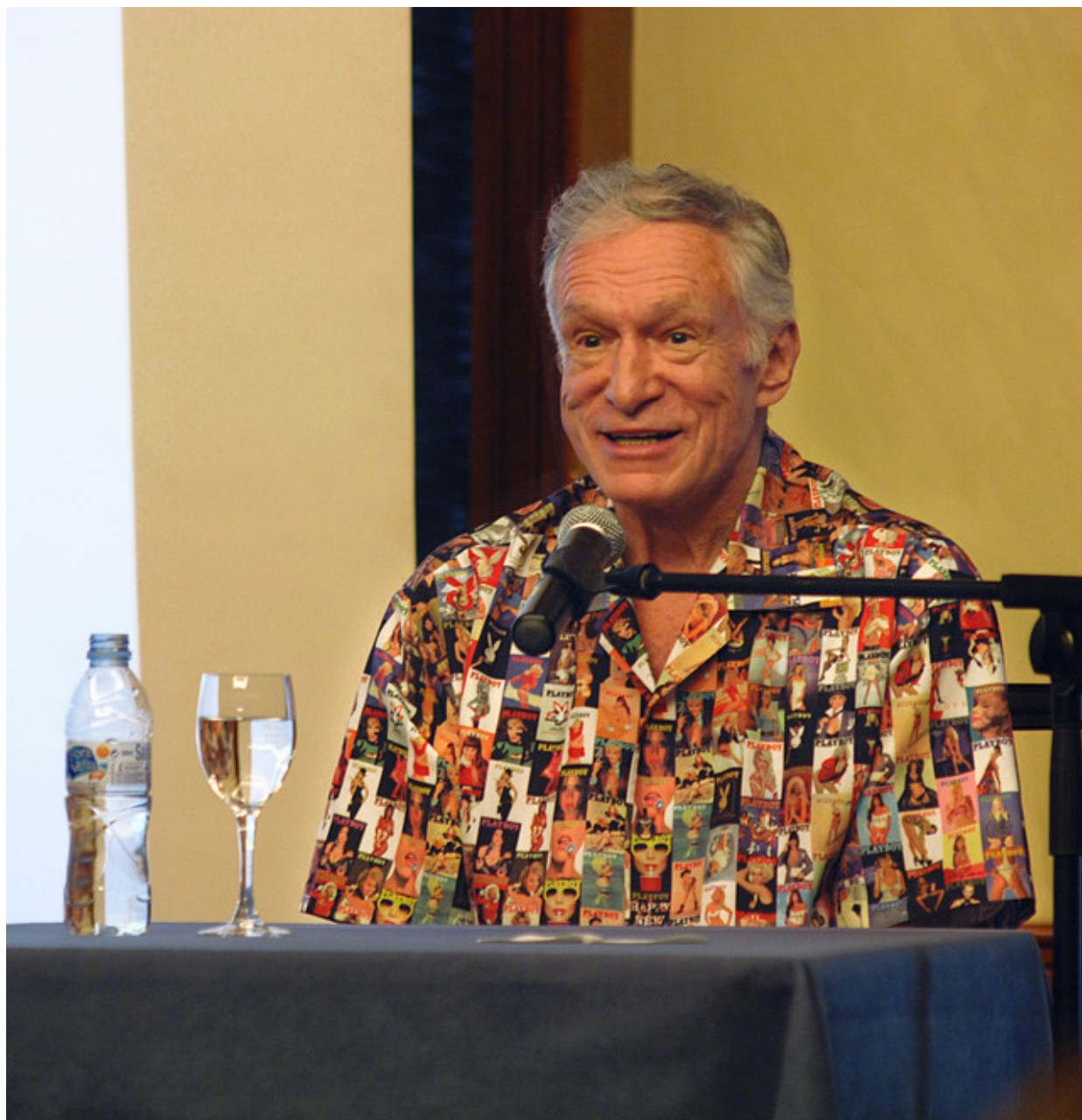
Хеф, с любимата си риза, съставена от корици на Playboy, отговаря на въпроси