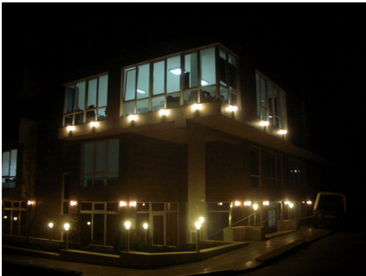
Новият офис на „Плейбой“ в квартал „Изток“ често светеше до късно нощем, когато имахме работа по приключването на броя

Издателската къща се разрастваше все повече и повече. Към „Плейбой“, „Грация“ и „Максим“ скоро щяха да се присъединят още две лицензни списания — „Джой“ и „ОК“. Разпределението върху двата просторни етажа на кооперацията беше следното — на единия са редакционните трудови колективи, а на горния — администрацията, която набъбваше неудържимо. Всеки месец там имаше назначения — пореден мениджър по рекламата, още един асистент на мениджъра по рекламата, мениджър по работата с клиенти, маркетинг мениджър, асистент на маркетинговия мениджър, ивент мениджър (такъв, дето организира най-различни събития и какво ще се яде и пие на тях), асистент на ивент мениджъра, асистент на мениджъра по дистрибуцията... Напълни се със служители с гръмки титли и неизяснени задължения. На долния етаж ние си стояхме в непроменен редакционен състав вече четвърта година и си бачкахме. С