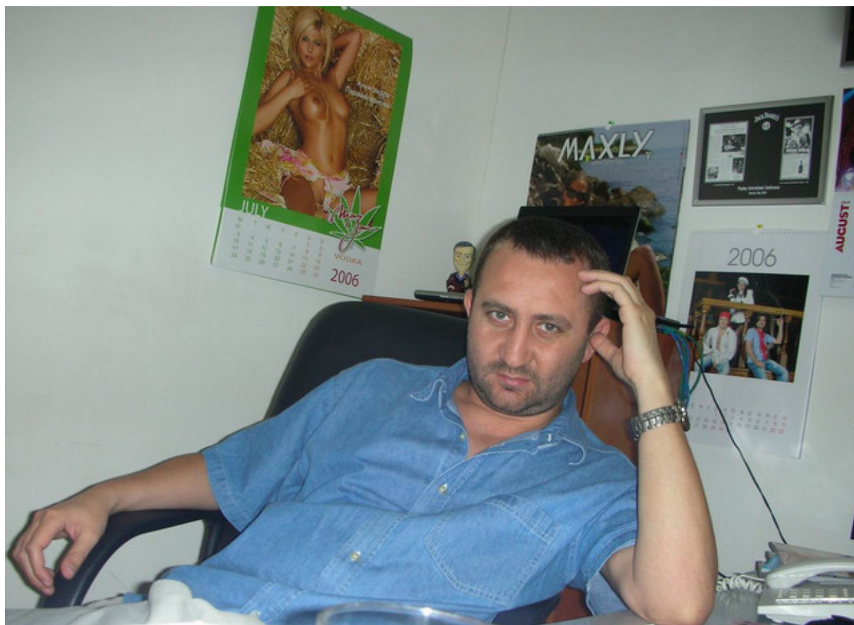
Плейбой-редакторът в кабинета си в бизнес център „Прима“, лятото на 2006 г.

От началото на октомври вече бяхме в нов офис. И то съвсем близо до дома ми — в квартал „Изток“. Можех да ходя пеша на работа, за не повече от 10 минути, по една от любимите ми улици — „Жолио Кюри“.