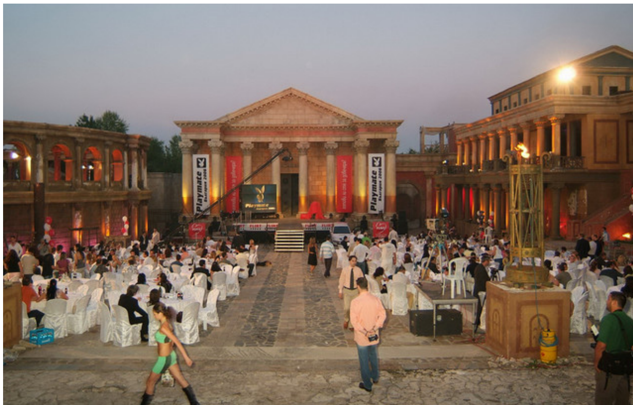
Третиият Playmate-конкурс се проведе в киноцентъра в Бояна, наред римския декор за суперпродукцията „Спартак“

Playmate of the Year 2006 се проведе в киноцентъра в Бояна в една гореща юлска нощ. Признавам, че бях подценил колко впечатляващо място е това. До последния момент подозирах, че сме избрали рискована локация за третия си конкурс. Опасявах се не само от дъжд и вятър, от каквито страдахме година по-рано на жълтите павета. Не ми харесваше тази отдалеченост от центъра на София и цивилизацията. Въобще, усещах един необясним дискомфорт.