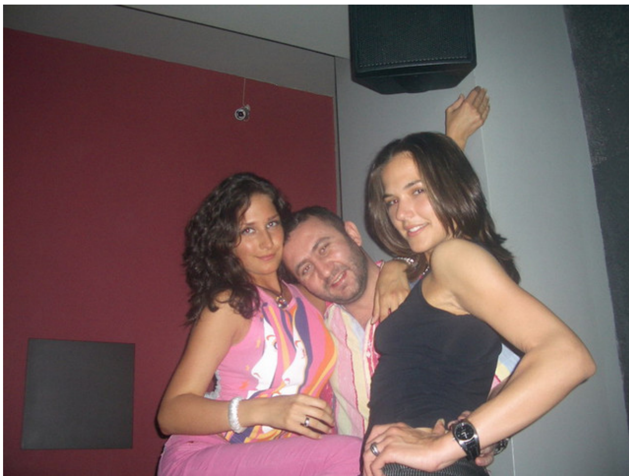
С Мадлен и Силва на Гергьовден 2005-а

178-сантиметрови цицорести манекенки, които очевидно не страдат от излишни притеснения и комплекси?