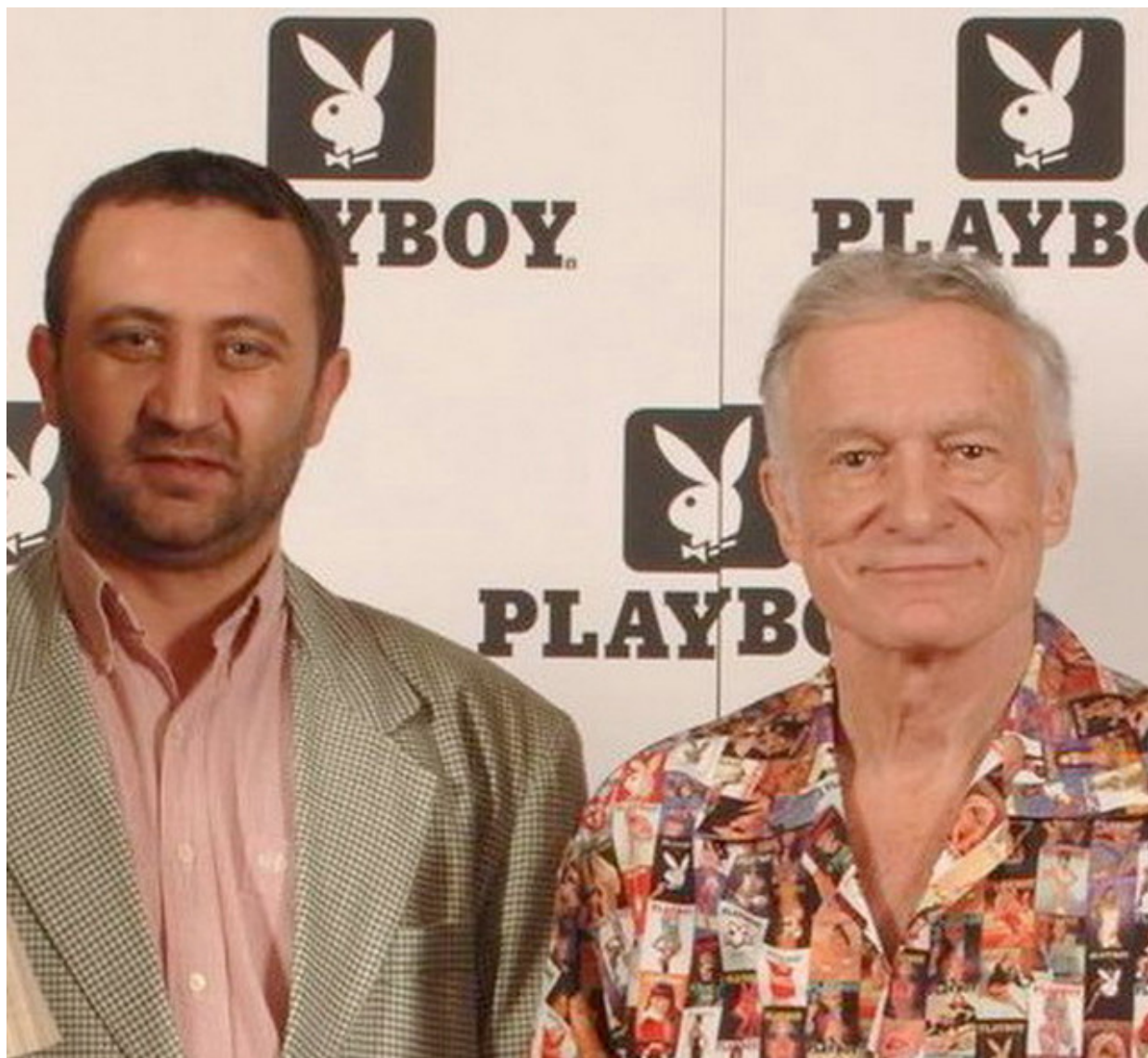
С колегата Хефнър в Барселона

След кратко негово встъпление започваме да му задаваме въпроси. Хеф отговаря стегнато и духовито. Не си придава важност. Не говори със самочувствието на човек, който знае всичко и който сега ще ни открехне за неща, които не сме и подозирали. Не пропуска нито един шанс да се самоиронизира. Отново повтаря прочутия си лаф „Аз съм една от най-късметливските котки на планетата“. Редакторите в залата го зяпат със смесица от възхищение, гордост и самосъжаление. Да, ние никога няма да имаме живота и легендата на този жилав старец, но поне е хубаво, че сме се докоснали до нея.