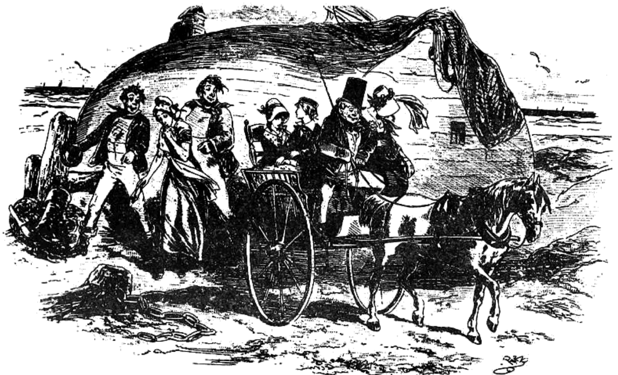
Мисис Гъмидж ни опечалява на тръгване

И въпреки това мислите ми се рееха безцелно. Не се съсредоточавах върху нещастieto, което бе притиснало сърцето ми, а се въртях несвързано около него. Мислех си за затворената ни и смълчана къща. Мислех си за малкото детенце, за което мисис Крийкъл каза, че залиняло и навярно щяло също да умре. Мислех си за бащиния си гроб в черковния двор край дома и за това, как и майка ми ще лежи там под дървото, което ми бе така добре познато. Когато ме оставиха самичък, качих се на един стол и се погледнах в огледалото. Очите ми бяха червени, а лицето ми бе тъжно. След няколко часа вече не ми бяха останали сълзи. Чудех се за какво трябва да мисля, когато наближа към къщи — тъй като щях да си отида за погребението. Спомням си, че бях обкръжен от някаква тържественост, и нещастieto ми ми бе придало важност в очите на другите момчета.