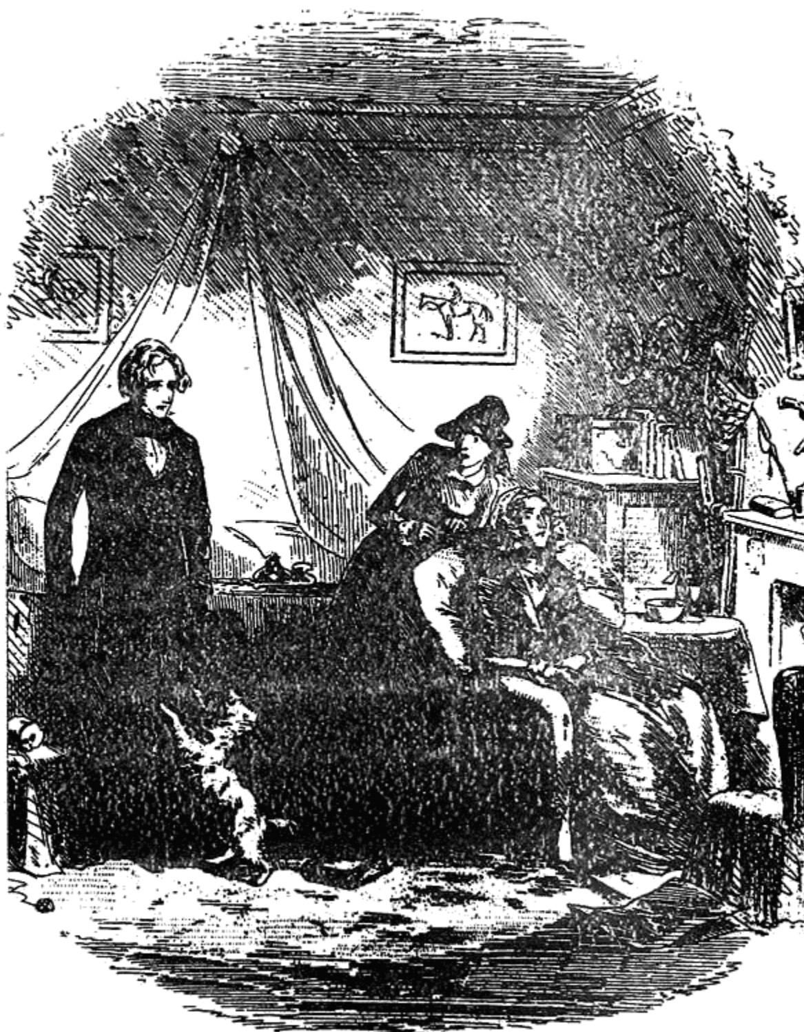
Донасям лоши новини

което още не беше подготвена. Но Роза Дартъл вдигна ръце в ужас и отчаяние и затули с тях лицето си.