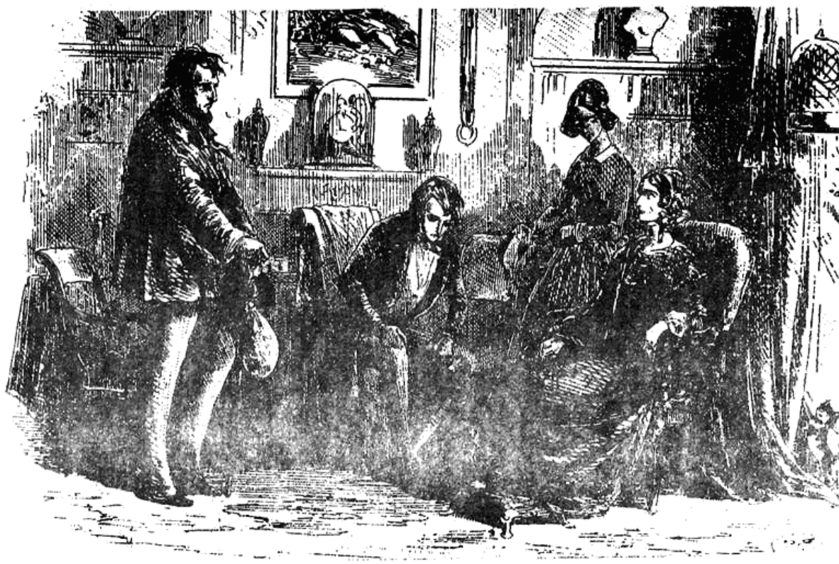
Мистър Пеготи и Мисис Стиърфорд

С тези думи си излязохме, като я оставихме изправена до креслото си, с горда осанка и красиво лице.