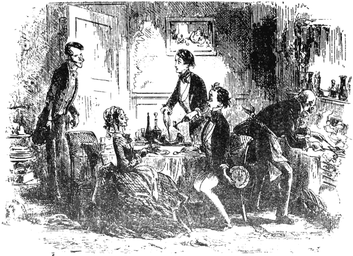
Обезпокояват ни, докато готвим

Беше между десет и единадесет часът, когато мисис Микобър стана, за да сложи официалната си шапка в белезникавокафявата кесия и да тури на глава всекидневното си боне. Мистър Микобър се възползува от момента, когато Тредълс си обличаше палтото, да мушне в ръката ми едно писмо и да ме помоли шепнешком да го прочета, когато имам време. Аз също се възползувах от случая, когато им държах свещта над парапета, да спра за миг Тредълс на площадката.