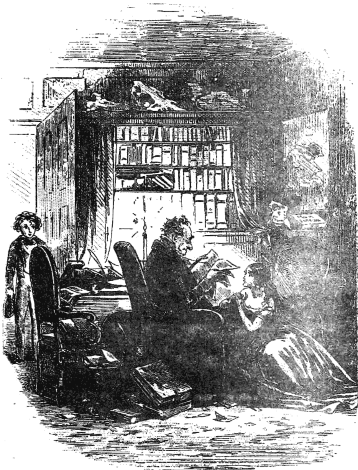
Връщам се при доктора след гостите