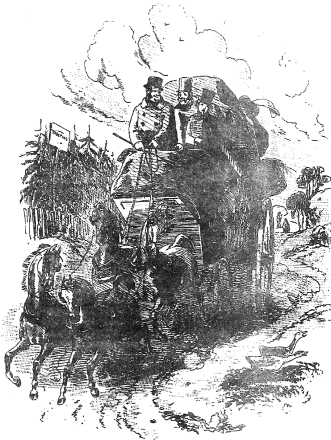
Първата ми житейска несполука