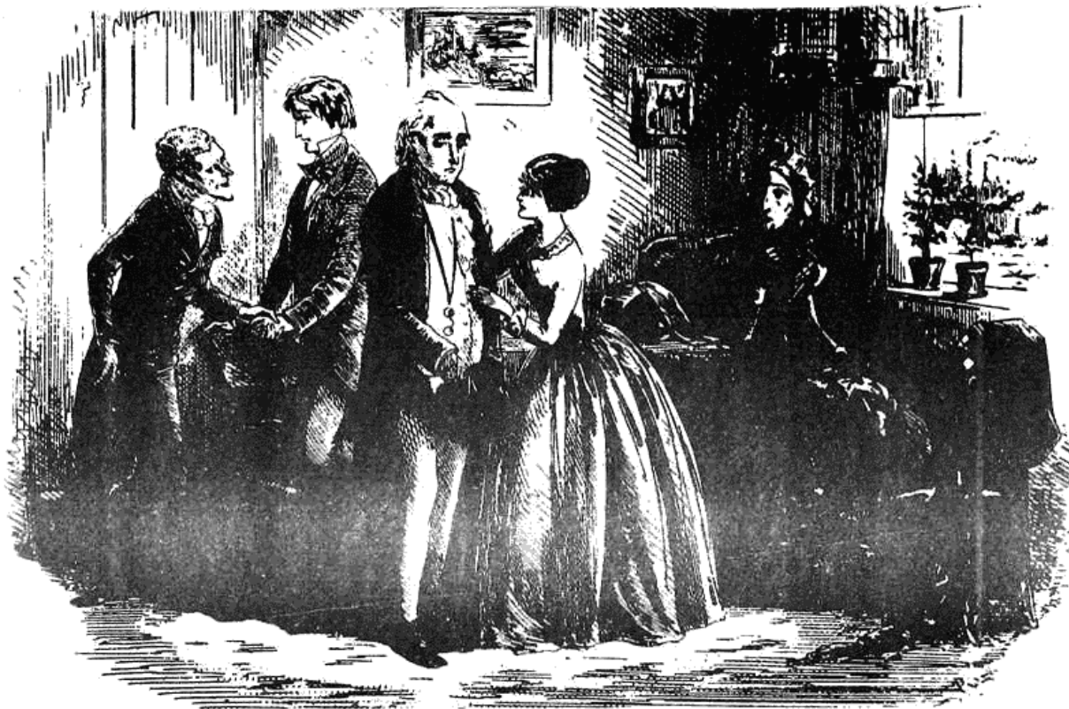
Мистър Уикфийлд и съдружникът му посещават леля

Леля, която по това време беше заета нещо с Пеготи в другата стая, не възнамеряваше да ни придружи до мястото, където бяха отседнали, обаче настоя аз да отида там с тях. Така и стана. Обядвахме заедно, след което Агнеса седна до него, както едно време, и му наля вино. Той взе само толкова, колкото тя му даде — като същинско дете — и тримата седнахме край прозореца, докато най-последно вечерта се спусна. Когато стана почти тъмно, той си полегна на един диван. Агнеса подложи възглавницата под главата му и постоя малко наведена над него, след което се върна до прозореца. Не беше още толкова тъмно, за да не забележа сълзите, които блестяха в очите ѝ.