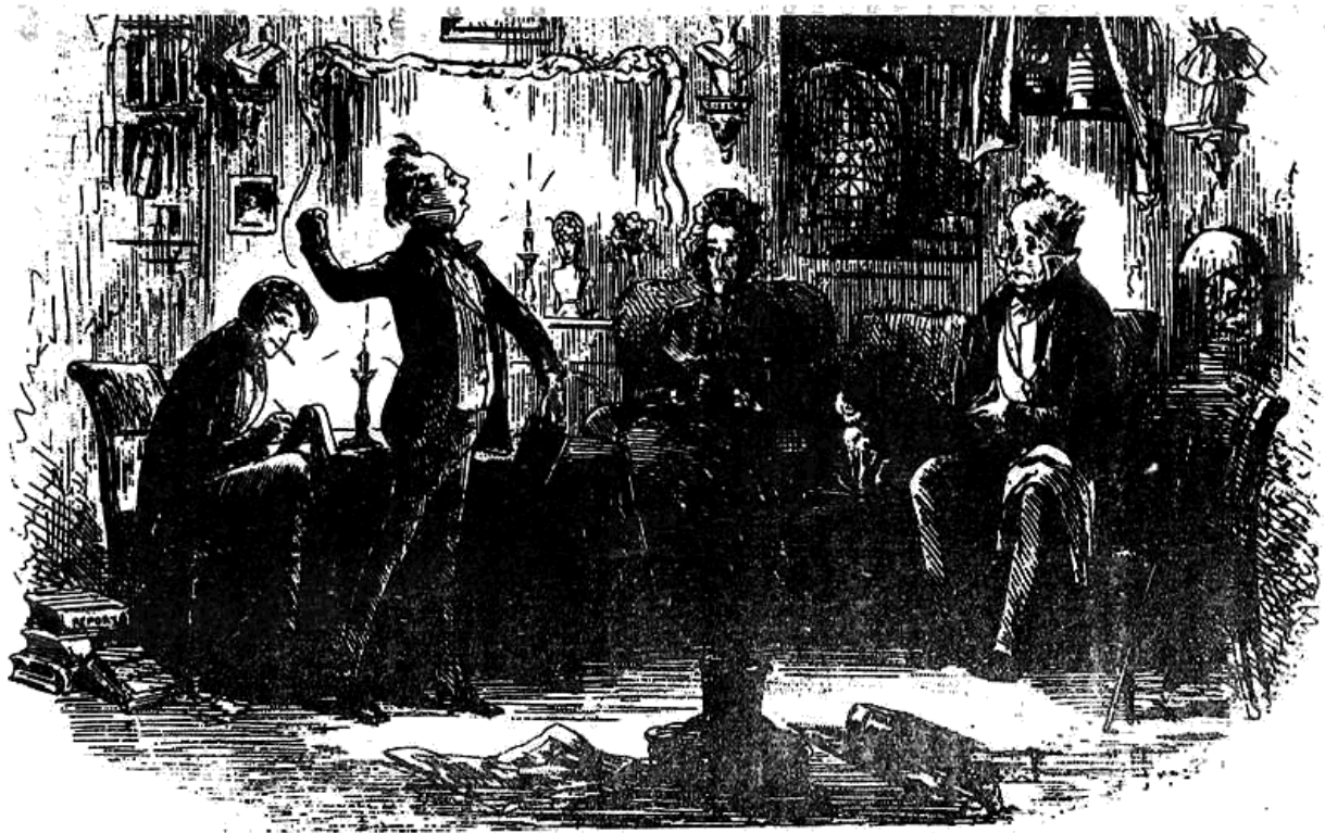
Записвам речите на парламентарния оратор Тредълс

Това ни вдъхна нови надежди. Тредълс и аз се отделихме за малко настрана, за да поговорим върху начина, по който щяхме да извършим на другия ден опита си (който излезе много сполучлив), докато мистър Дик ни гледаше загрижено от мястото си.