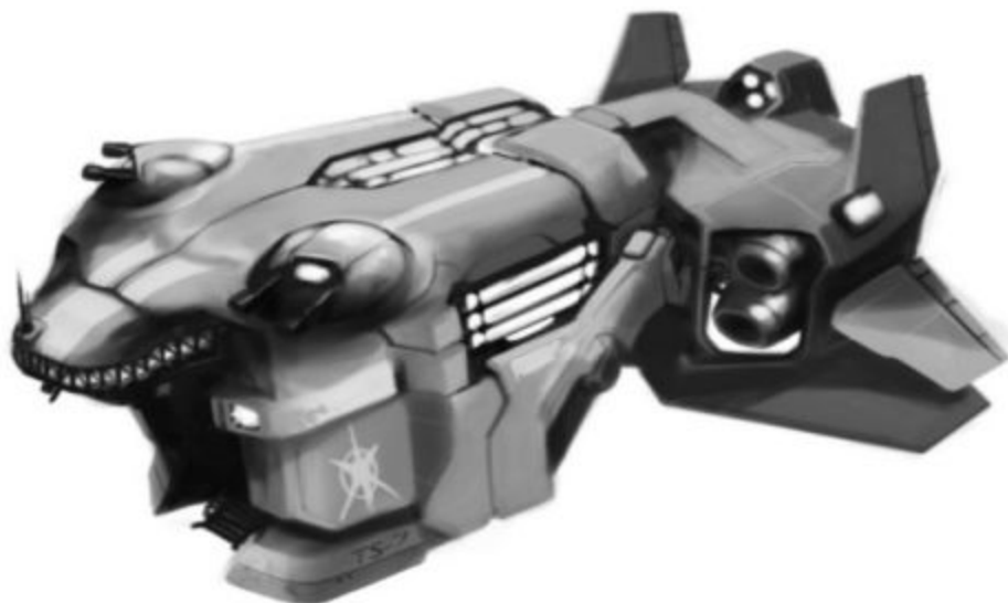
Транспортен кораб TS-7 на Седми флот

След около два часа полет те наближиха планетата Скайла, намираща се в звездна система Сигма 4865. За разлика от Сердика, Скайла не беше приветлива, нито гъсто населена. Характеризираше се със скалиста и пуста повърхност, лишена от естествена атмосфера и живот. Намиращите се на повърхността военни бази и мини за добив на полезни изкопаеми се подсигуряваха с изкуствена атмосфера чрез масивни прозрачни куполи, които ги покриваха напълно.