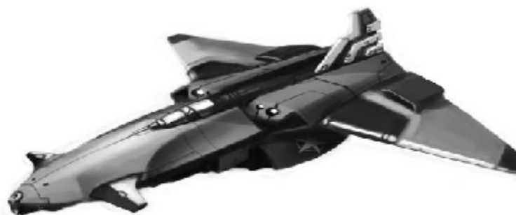
Учебен изстребител „Хигрус 25“

предизвикваше ужас у аркусианците. Ако там просто пишеше „Александър“, щеше да е далеч по-лесно, но сега на плещите му тежеше отговорността да се представи достойно за името, което носеше.