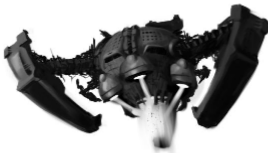
Тайнствената аркусианска космическа станция

Когато най-сетне достигна до мястото на разбития ягуар, Арвин включи късо обхватния скенер и започна да сканира пространството, търсейки капсулата с кокпита. Разбира се, ако включеше средно обхватния скенер, можеше веднага да го открие и то още преди да се е приближил, но тогава дебнещите аркусианци можеха да го засекат. Затова действаше крайно предпазливо. След около час търсене най-сетне откри отломък, наподобяващ по форма и размери на кокпита. Когато се приближи така, че да има визуален контакт, Арвин разпозна, че това наистина е кабината на Златина. Тялото ѝ можеше да се види вътре неподвижно и той нямаше как да прецени какво е състоянието ѝ. Не смееше да използва и радиостанцията. С прецизна маневра приближи своя кораб и отвори вратичката на малкия товарен отсек. Там можеше да се побере кокпита от разбития ягуар. Когато товарът се оказа на мястото си, вратичката се затвори и единствената мисъл на Арвин вече беше как най-бързо да се отдалечи от орбиталната станция. Не можеше да включи двигателите на пълна мощност, тъй като веднага щяха да го забележат и имаше голям шанс да бъде поразен, преди да успее да излезе от обсега на батареите. За това предприе тактиката да се отдалечава бавно използвайки минимална мощност.