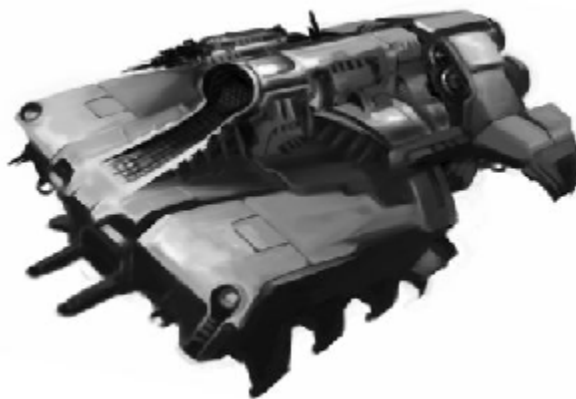
Аркусиански транспортен кораб

последните, които щяха да се натоварят на този кораб, защото след като вратата се затвори до ушите на Алекс достигна звукът от засилване на двигателите. Усети се лека вибрация, докато тръстерите постепенно увеличаваха тягата си. Скоро тримата почувстваха, как корабът се отлепя от основата на докинг станцията и започва да лети напред към открития космос.