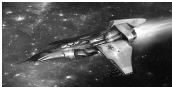
Многоцелеви космически изстребител Ягуар 7

— Съгласна съм! — двамата започнаха да се упражняват. Габриела очакваше да ѝ е много по-трудно с бойния кораб, но всъщност се оказа тъкмо обратното. Тя се удиви колко лесно се правят маневрите с ягуара, съчетаващ мощ и маневреност, както никоя друга машина. Единственото, с което трябваше да внимава, бе скоростта по време на остри завои, тъй като „G“ пренатоварването щеше да стане повече, отколкото организъмът и можеше да понесе. Иначе възможностите на изстребителя изглеждаха безкрайни. Съвсем скоро свикна с управлението и базовите маневри вече не представляваха никакво предизвикателство за нея.